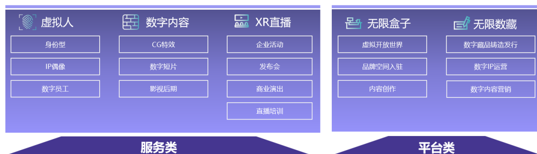
图：虚拟数字业务全景图

(2) 虚拟数字业务：公司依托专业级硬件设施和创作团队，帮助企业/品牌在新流量时代创建虚拟数字形象及衍生资产，搭建品牌商业化基建。运营团队将以客户需求为原点，提供创新式适用于多维度应用场景的内容运营及商业化解决方案。目前公司虚拟数字业务主要分为服务类和平台类两大业务模块，可为客户提供数字人、数字内容、数字场景、XR 直播、数字藏品的制作、发行等服务，使品牌及其衍生资产在新流量时代进入消费者视野并最终沉淀到品牌流量池。